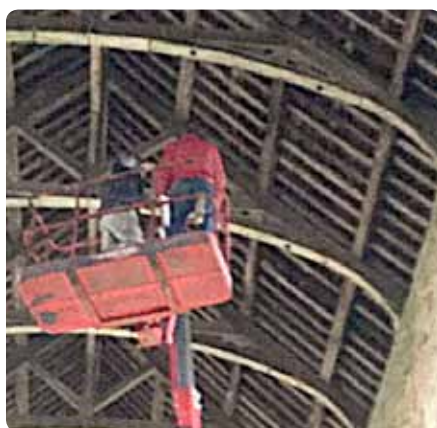
Après examen, la charpente est solide et en bon état général.

Les travaux d'études de sécurité demandés par la Mairie d'Olivet ont été finalisés par la société AIA d'Angers. Il semble que rien de suspect n'ait été détecté, et que les visites pourront continuer en toute sérénité pour tout le monde. A partir d'une nacelle, l'entreprise de maçonnerie Yves Dufrasse est interve-