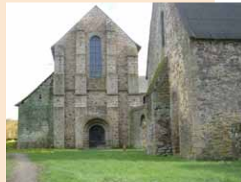
Vue virtuelle de l'Ouest

Nous avons une idée précise de l'aspect de la façade, car ses dimensions sont les mêmes que celles du pignon du transept Nord. La vue, récemment dégagée, a permis ce montage photo avec le bas-côté Nord virtuellement reconstruit.