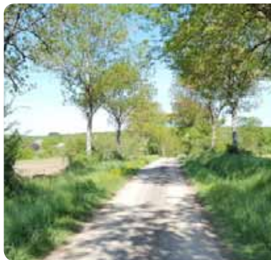
La voie communale étroite menant à l'abbaye.