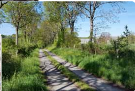
Le chemin d'accès à l'abbaye qui devra être aménagé pour accueillir les visiteurs.