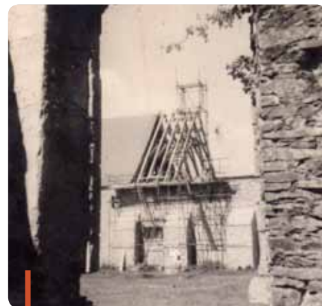
Un chantier de reconstruction de la partie Nord est ouvert.