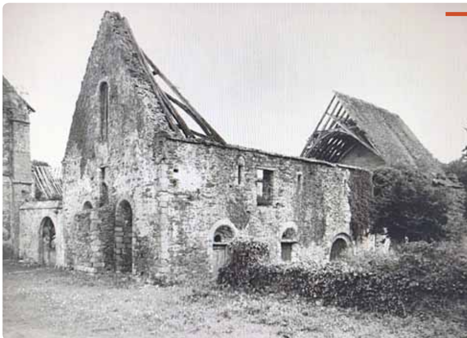
1954 : comme l'ensemble du site, spectacle de désolation pour ce bâtiment dont la plus grande partie de la charpente a disparu. Seule, une partie de celle d'origine (datée XII e ) a miraculeusement résisté.