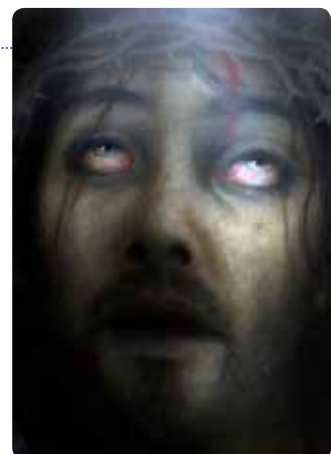
Le Christ à l'agonie : peinture à l'huile de l'artiste de 100 cm x 70 cm. Elle sera réinstallée à l'abbaye.

Étain de même dimension représentant un cerf qui figurait sur une fresque disparue du bâtiment Sud.