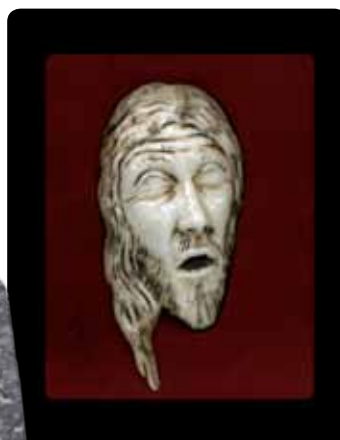
Sculpture en os de bœuf.

Reproduction en étain d'une tomette de 8,5 cm que l'on peut retrouver à plusieurs endroits dans l'abbatiale.