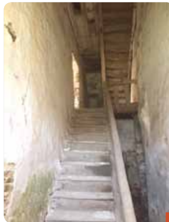
L'intérieur du logement : l'accès au premier étage se fait par un solide escalier de bois.