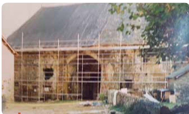
Le chantier de restauration démarre en 1989.