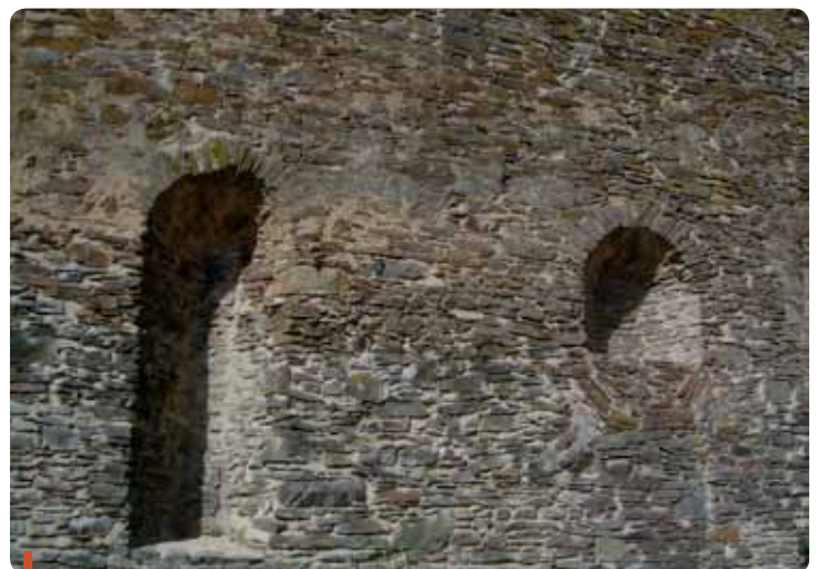
Sur le pignon Est, deux ouvertures murées laissent supposer l'existence d'une chapelle dans cette partie.