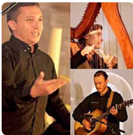
Ensemble I SENTIERI.